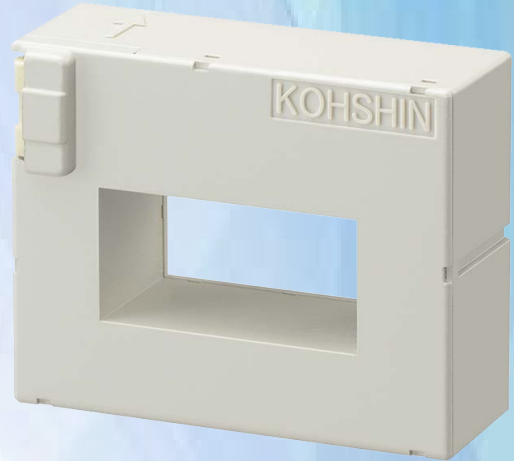
< 母线安装方式 >

用途 通用变频器、伺服驱动器、电源设备、不间断电源(UPS)、电焊机、光伏发电系统